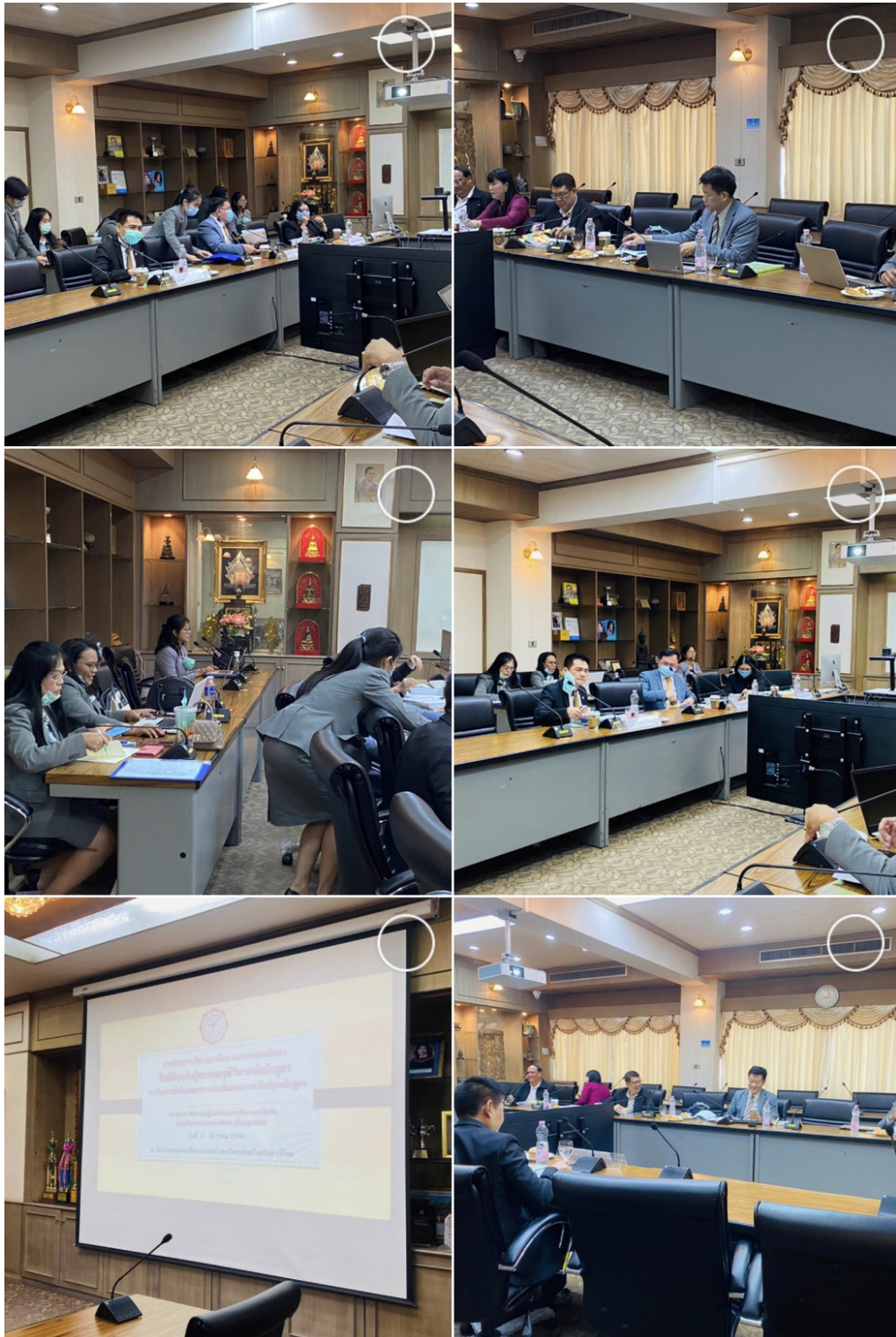
คณาจารย์และนิสิตร่วมกันรับการวิพากษ์วิจารณ์หลักสูตรเพื่อการปรับปรุงและจัดทำหลักสูตรหลังการวิพากษ์ ของผู้ทรงคุณวุฒิสำหรับดำเนินการตามขั้นตอนการพัฒนาหลักสูตรในวันที่ 21 ธันวาคม พ.ศ.2563