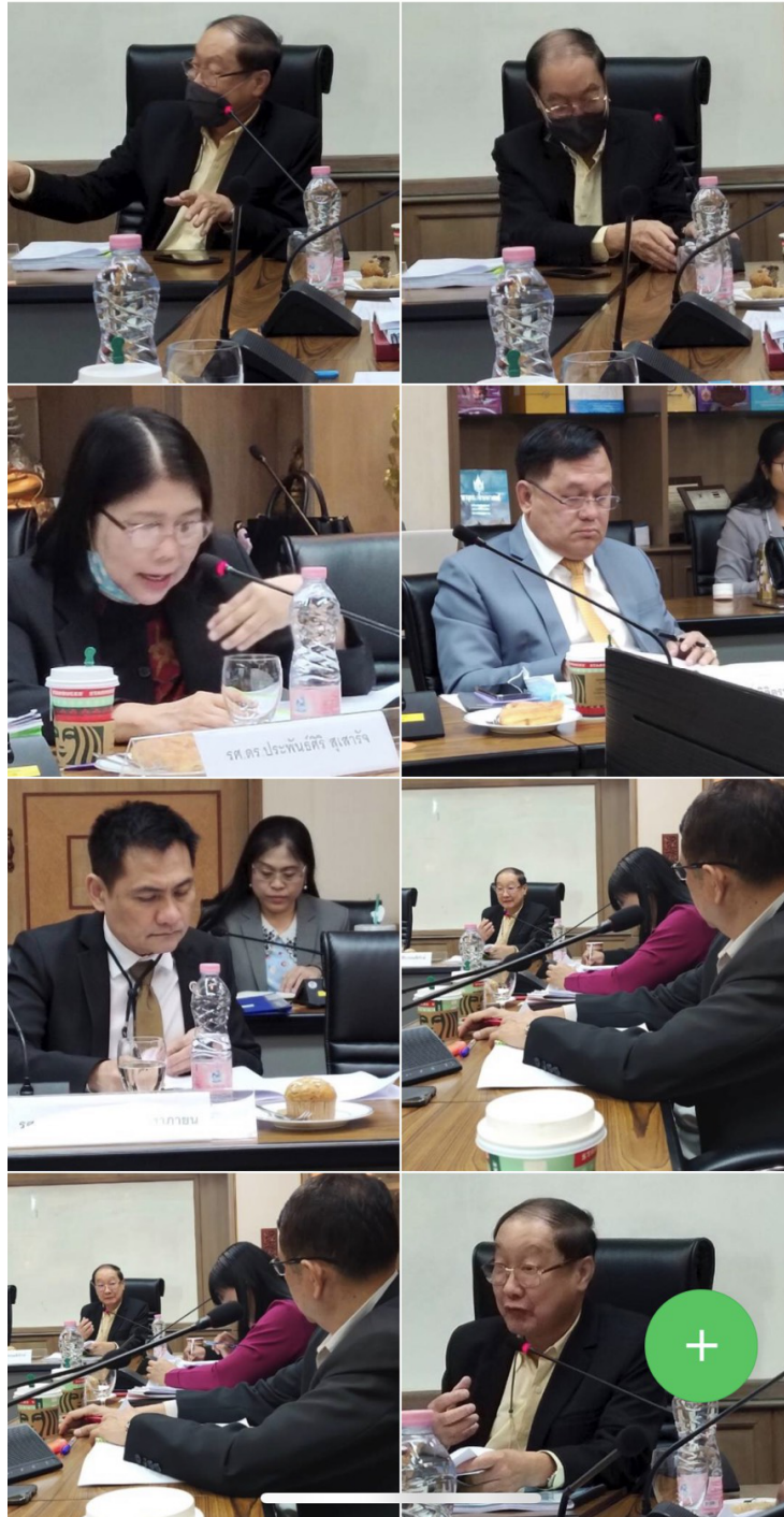
ภาพกิจกรรมการวิพากษ์หลักสูตร ฉบับปรับปรุง พ.ศ.2564 โดยผู้ทรงคุณวุฒิ