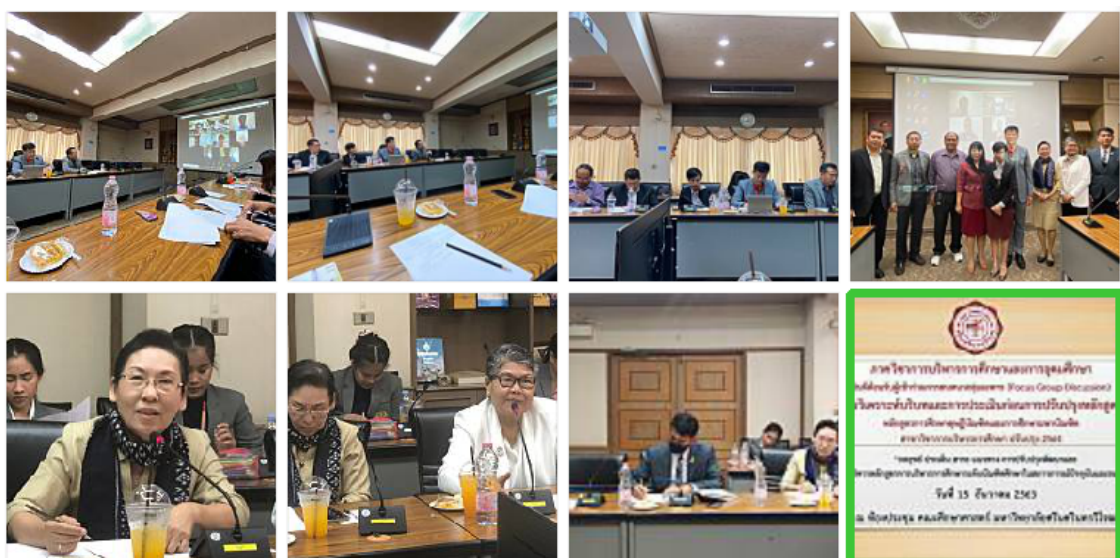
ภาพกิจกรรมสนทนากลุ่มเฉพาะรับฟังการประชาพิจารณ์จากผู้มีส่วนได้เสีย (ประเมินปัจจัย บริบท สภาพแวดล้อมและผู้มีส่วนได้เสีย) เพื่อการปรับปรุงและพัฒนาหลักสูตร ปี พ.ศ.2564 ในวันที่ 15 ธันวาคม พ.ศ.2563